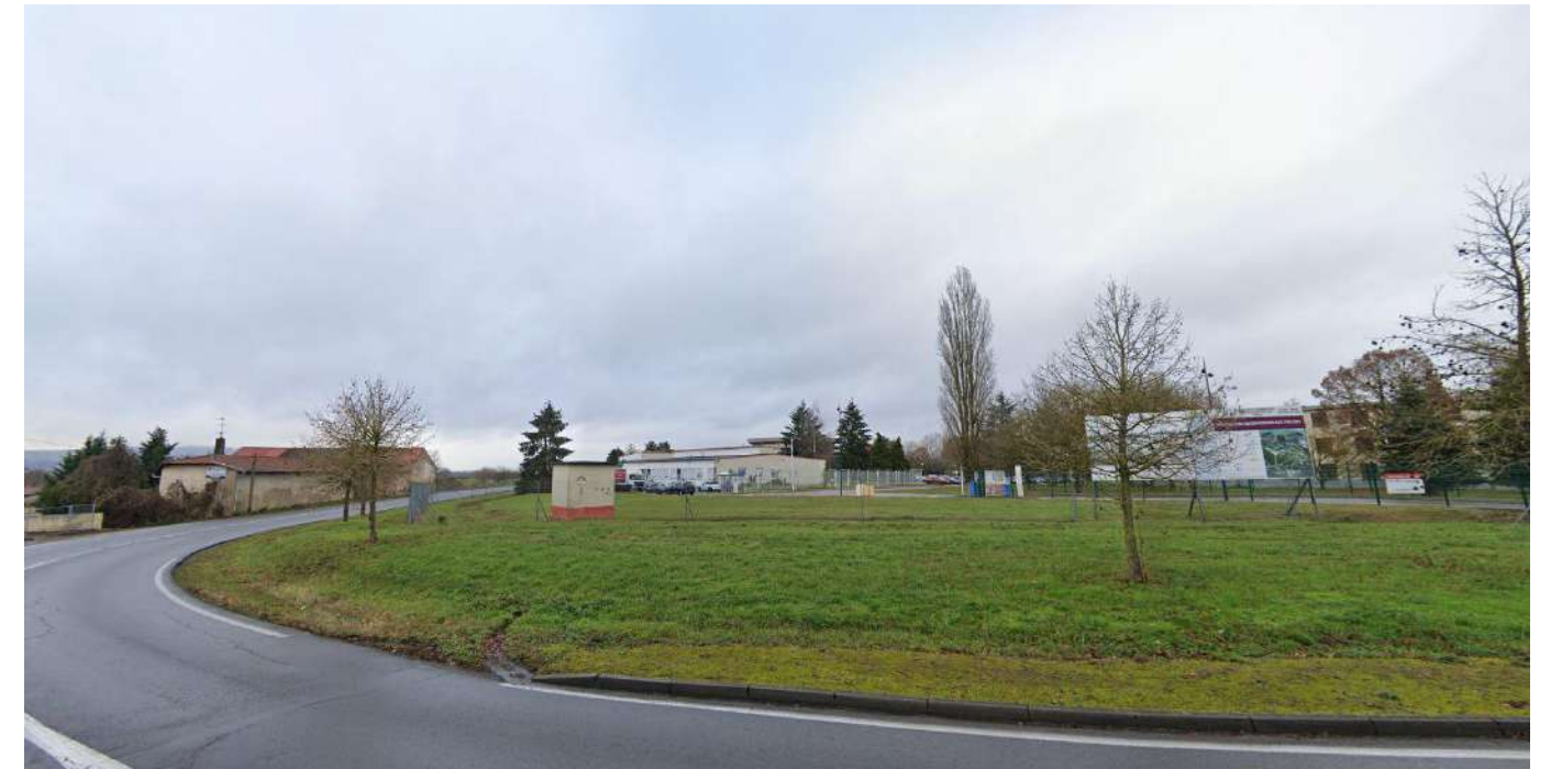
PC8-02 Vue lointaine

SCCV METZ AUGNY 3, Ave Hoche-56/65 Rue de Courcelles AUGNY - PARIS 007 - PC8-01 - 15/06/2022 - Date d'export : 24/06/2024