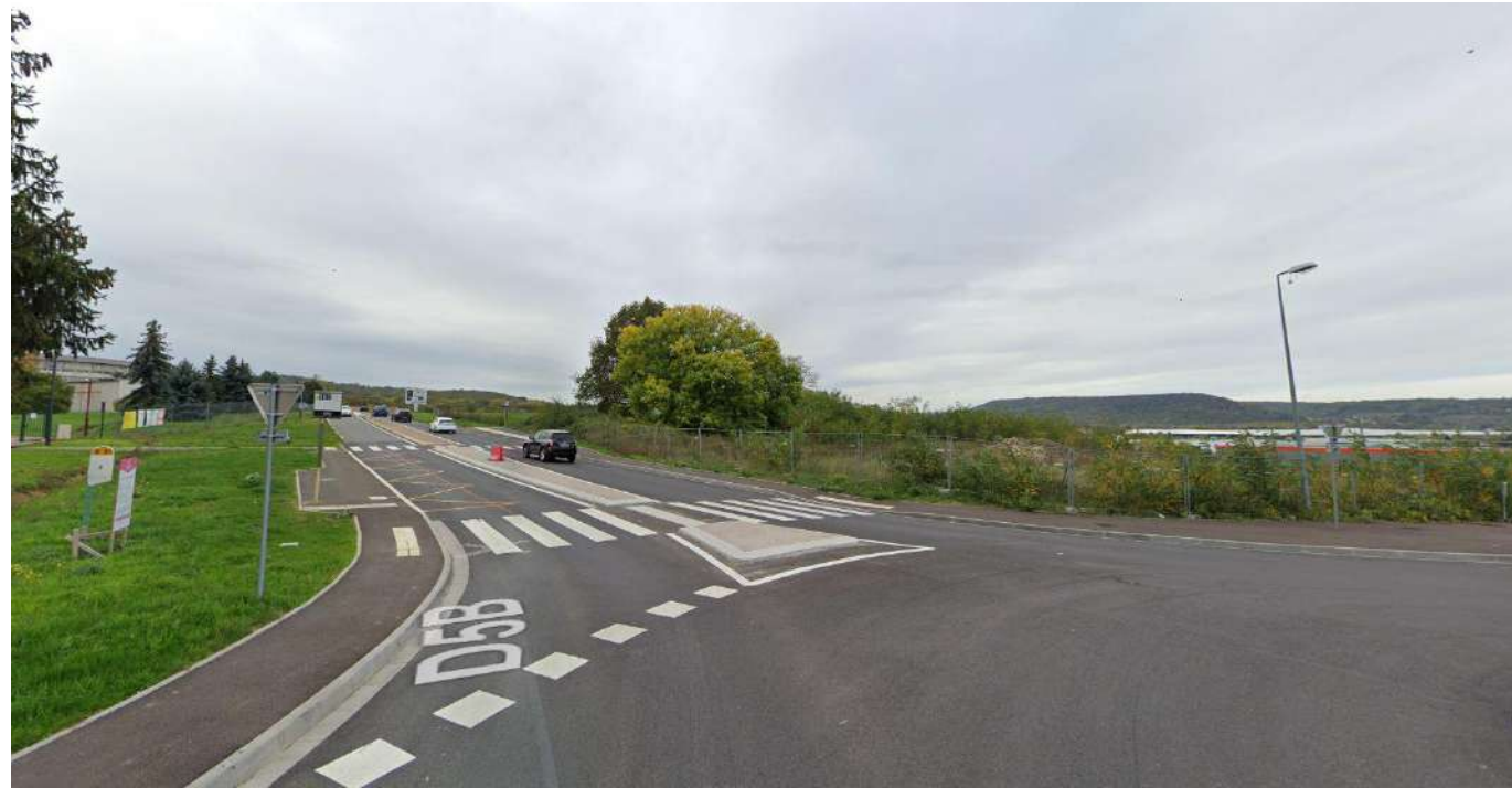
PC8-01 Vue lointaine