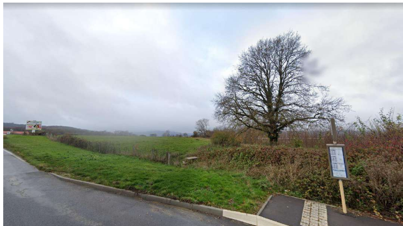
PC7-01 Vue proche