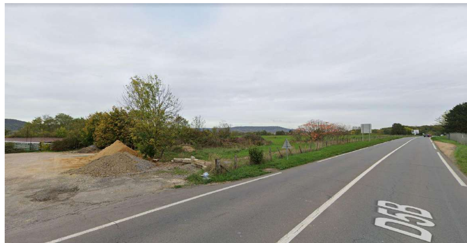
PC7-02 Vue proche

SCCV METZ AUGNY 3 Ave Hoche-56/65 Rue de Courcelles AUGNY - PARIS 007 - PC75008 Date de mise à jour : 15/06/2022 - PC7_1_1.pdf - Date d'export : 24/06/2024